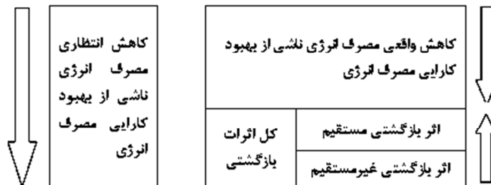
شکل (۱). تقسیم‌بندی اثرات بازگشتی