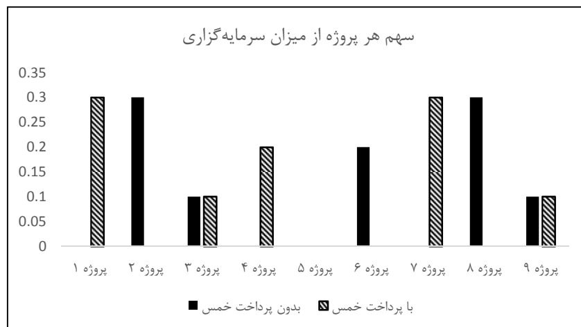
شکل ۲- مقایسه میزان تخصیص سرمایه در پروژه‌های مختلف در دو حالت بدون محاسبه خمس و با محاسبه خمس