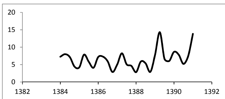
نمودار ۲. روند شاخص عدم تطبیق مهارت برای کل کشور از بهار سال ۱۳۸۴ تا بهار سال ۱۳۹۱

مطالعه حاضر به بررسی دقیقتر وضعیت فعلی بازار کار کشور از نظر عرضه و تقاضای مهارت می‌پردازد؛ در این راستا و به منظور کمی کردن مسئله عدم تطبیق مهارت، از اطلاعات موجود در طرح آمارگیری نیروی کار از سال ۱۳۸۴ تا سال ۱۳۹۱ استفاده شده است. روند عدم تطبیق مهارت از بهار سال ۱۳۸۴ تا بهار سال ۱۳۹۱ برای کل کشور در نمودار زیر نشان داده شده است. همانگونه که ملاحظه می‌گردد، عدم تطبیق مهارت از مقدار ۷/۲۷ در بهار سال ۱۳۸۴ به میزان ۱۳/۸۳ در بهار سال ۱۳۹۱ افزایش یافته است.